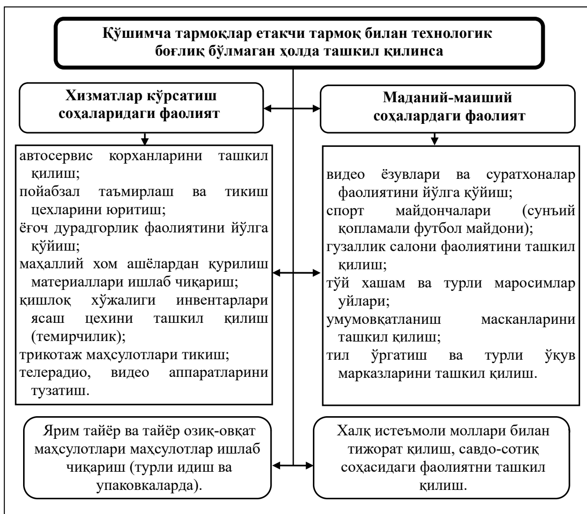
1.2-расм. Фермер хўжаликларида қўшимча тармоқларнинг етакчи тармоқ билан технологик боғлиқ бўлмаган ҳолда ташкил этиш йўналишлари 2

Айни пайтда таъкидлаш лозимки, фермер хўжаликларида ходимларни ижтимоий қўллаб-қувватлаш мақсадлари доирасида қўшимча тармоқларда етиштирилган маҳсулотлар ходимлар учун “ижтимоий пакетлар” доирасида ҳам сарфланиши мумкин. Тадқиқотлар кўрсатишича, фермер хўжаликларида қўшимча тармоқларни ривожлантиришда ечимини кутаётган масалалар ҳам талайгина бўлиб, бизнинг назаримизда улар асосан қуйидагилардан иборат (1.2-расм).