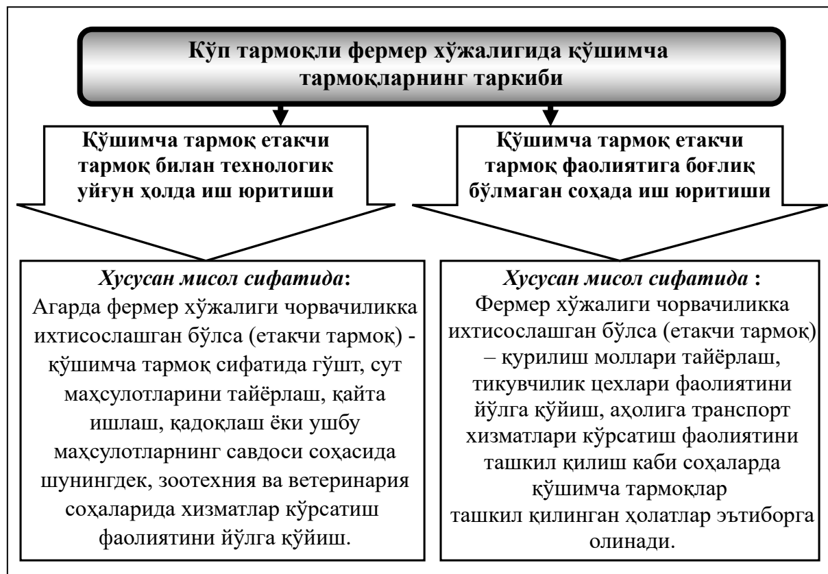
1.1-расм. Фермер хўжаликларида етакчи тармоқлар билан технологик уйғунликда ташкил қилинадиган қўшимча тармоқ таркиби 1

Фермер хўжаликларида қўшимча тармоқларни ташкил қилишда фермер хўжаликлари тадбиркор сифатида ўз хусусий манфаатлари доирасида фаолият юритгани ҳолда, қўшимча тармоқларни ташкил этган тўлик ихтиёрий равишда амалга оширилиши лозим. Шундагина фермерда эркин бозор талабларига мослашиш имкони пайдо бўлади, таннархи рақобатга бардошли маҳсулотлар етиштириб бозорга тақдим этишга юқори даражадаги манфаат юзага келади.