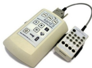
Рисунок 4 – Прибор KARDi3/9

Для объективизации оценки качества обработки спуска применяется тензодатчик, используемый в методе тензометрии, обусловлен использованием прибора KARDi3/9, см. рисунок 4.