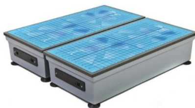
Рисунок 3 – Тензодинамографическая платформа

Для оценки стабильности изготовления и распределения мышечных усилий используется тензодинамографическая платформа, см. рисунок 3.